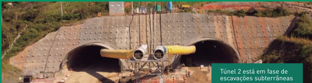
Túnel 2 está em fase de escavações subterrâneas