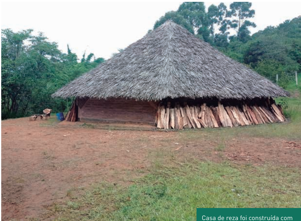
Casa de reza foi construída com recursos do CI-PBA do Contorno

Para a construção do Contorno Viário de Florianópolis, foi necessária a supressão vegetal em algumas áreas da futura rodovia. Parte da madeira retirada da área dos túneis do Contorno foi doada para a aldeia indígena M'Biguaçu, que utiliza a lenha para rituais e produção de chás e itens de medicina indígena, como chás.