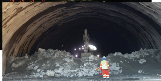
Cada pista do túnel 4 terá 820 metros de extensão

Com 821 metros de extensão em cada pista, o túnel 4 está localizado na divisa entre os municípios de Biguaçu e São José. A partir de agora,