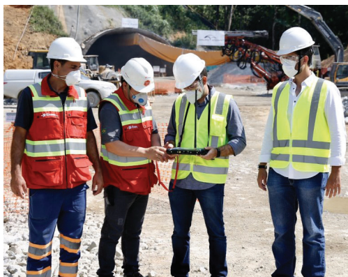
Representantes da ANTT acionaram o desmanche de rochas