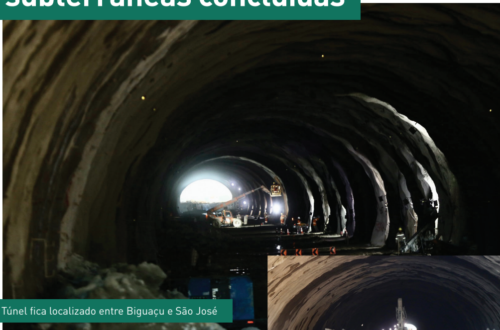
Túnel fica localizado entre Biguaçu e São José

No dia 16 de março, a pista sul do Túnel 4 teve o avanço completo da frente de escavação, de uma ponta a outra. O marco, conhecido como “vazamento do túnel”, representa um avanço nas obras do Contorno, já que esse se torna o primeiro túnel da obra a registrar as escavações completas nas duas pistas.