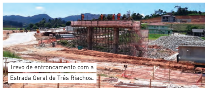
Trevo de entroncamento com a Estrada Geral de Três Riachos.

As intersecções do Contorno com estradas e rodovias irão possibilitar o acesso de forma segura à nova rodovia.