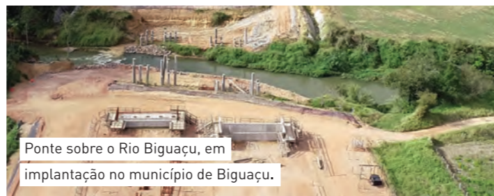
Ponte sobre o Rio Biguaçu, em implantação no município de Biguaçu.

Para construir uma Obra de Arte Especial, são necessárias, em média, 40 pessoas dedicadas integralmente a cada obra.