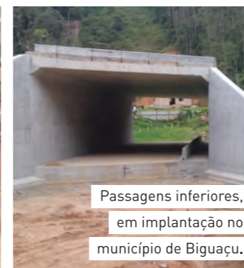
Passagens inferiores, em implantação no município de Biguaçu.