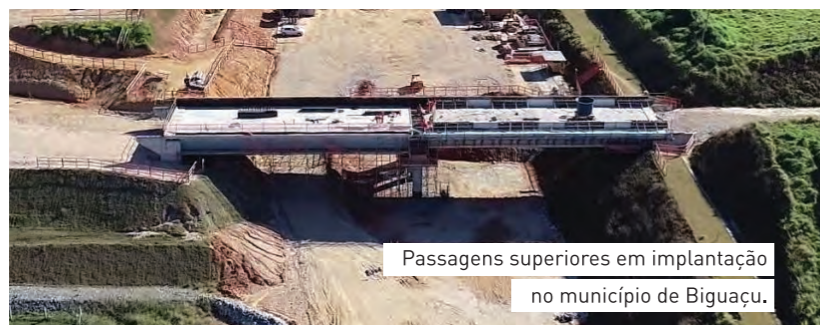
Passagens superiores em implantação no município de Biguaçu.

Entre os principais desafios das Obras de Arte está o trabalho das fundações. Apesar de haver um amplo estudo prévio, existem muitas variações de solo encontradas.