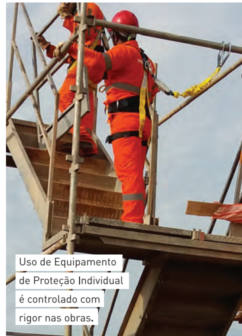
Uso de Equipamento de Proteção Individual é controlado com rigor nas obras.

de Investimentos do Contorno Viário, garantir a segurança e a vida dos trabalhadores é prioridade máxima do grupo e várias ações são desenvolvidas para isso. "Temos um volume muito elevado de movimentação de terra e transporte de materiais com constante deslocamento de caminhões e máquinas. Para mitigar esse risco, possuímos colaboradores, os chamados spotters, que são profissionais que atuam exclusivamente na sinalização para evitar que outros colaboradores interfiram nessa área controlada, evitando acidentes", destacou.