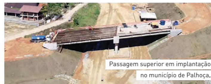
Passagem superior em implantação no município de Palhoça.

Toda a produção de pré-moldados, como vigas de sustentação e pré-lajes, por exemplo, é feita fora da obra, aumentando a produtividade e a qualidade, além de otimizar o processo de construção das obras.